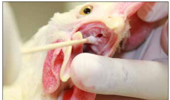
图3.采集咽拭子时确保拭子已插入鼻后孔