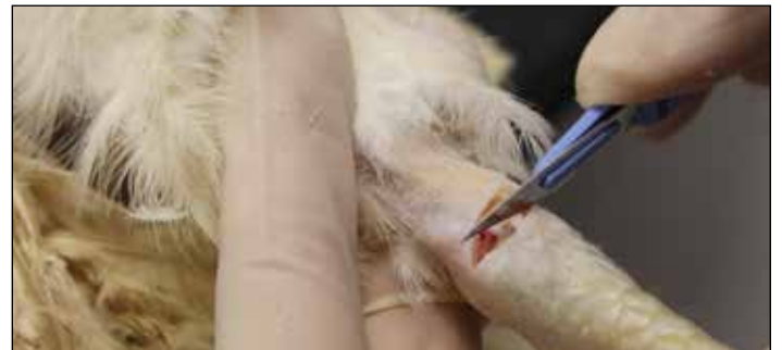
图5.切入关节前先拔除羽毛并用酒精棉清洁皮肤。