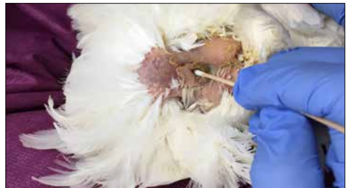
图7.露出泄殖腔, 将拭子轻轻插入泄殖腔并在粘膜表面旋转。