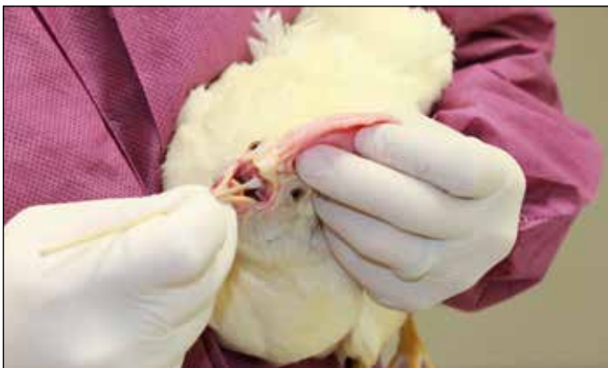
图2.采集咽拭子时固定鸡只的正确方法