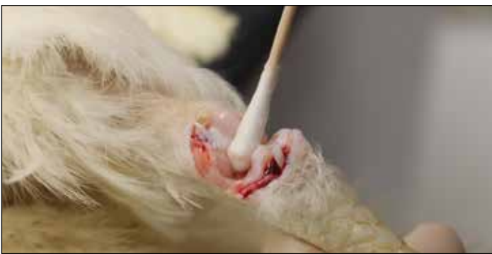
图6.擦拭感染关节的滑液囊表面。