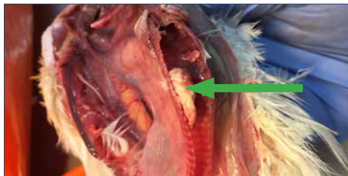
Figura 3. Traqueítis Fibrinohemorrágica característica de ILT. Este tapón puede obstruir la tráquea y causar muerte por asfixia.

Los signos clínicos y las lesiones por necropsia pueden sugerir ILT pero no se pueden diferenciar de otras enfermedades con presentaciones similares. Los diagnósticos diferenciales principales son la enfermedad de Newcastle, bronquitis infecciosa, influenza aviar y viruela húmeda.