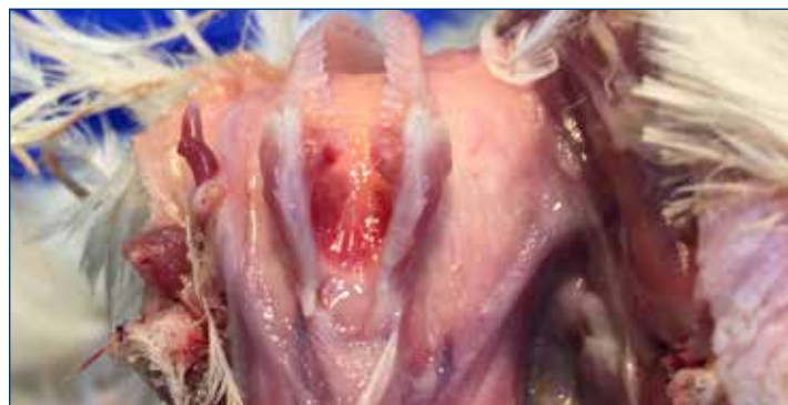
Figura 2. Inflamación de la laringe y de la tráquea.

El virus ILT es un virus con envoltura lo cual lo hace vulnerable a muchos químicos desinfectantes comerciales comunes, incluyendo los que contienen cresol, peróxido de hidrógeno, detergente-halógeno o desinfectantes basados en yodo. El virus también puede inactivarse rápidamente (48 horas o menos) en un ambiente bajo la exposición directa a la luz del sol y/o de altas temperaturas (38°C/100.4°F).