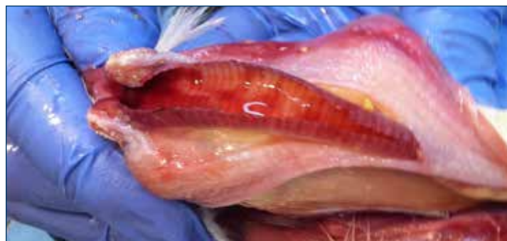
Figura 4. La hemorragia en la tráquea es un signo común de infección.