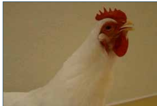
Figura 1. Ave con el cuello extendido, demostrando dificultad para respirar.

La presentación clínica de ILT en un lote puede variar dependiendo de la virulencia de la cepa viral desafiante, la ubicación del contacto viral inicial 2 . El curso de la enfermedad también varía según la patogenicidad de la cepa viral. Los lotes infectados con cepas virales más leves pueden recuperarse en tan solo 10 días, mientras que la recuperación de cepas más patógenas puede tardar hasta 4 semanas.