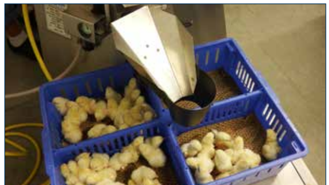
Figura 2. El Procesador de Servicio Avícola (PSP) de Nova-Tech clasifica las aves en las cajas.