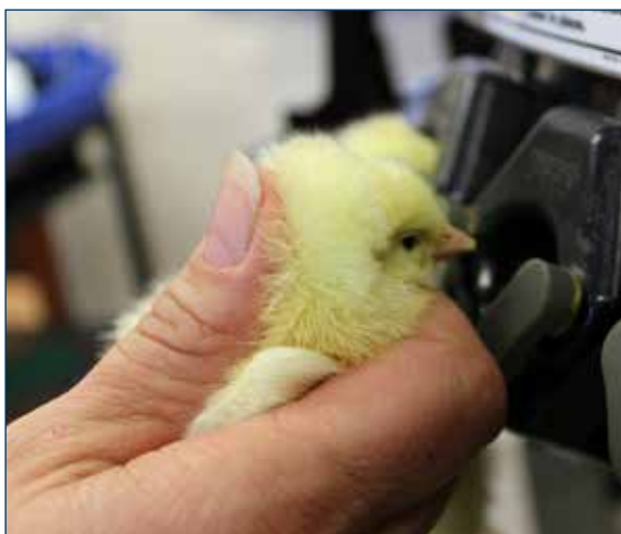
Figura 3. Colocando las aves en los sostenedores de cabezas.