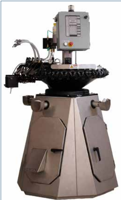
Figura 1. Procesador de Servicio Avícola (PSP) de Nova-Tech.

El despique con tratamiento infrarrojo (IRBT) se realiza con una máquina llamada Procesador de Servicio Avícola (PSP), patentada por Nova-Tech y disponible para su alquiler o arrendamiento (Figura 1). Esta máquina también proporciona inyecciones subcutáneas por medio de inyecciones en el cuello, lo cual reduce el error humano asociado con las inyecciones a mano o inyectores individuales.