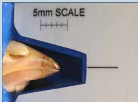
Figura 6. Doce días después del tratamiento - el tejido del pico tratado se oscurece.