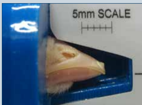
Figura 5. Un día después del tratamiento - el tejido del pico tratado es de color blanco (en lugar de rosado).