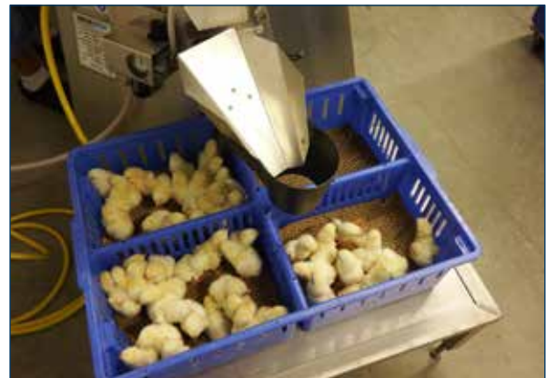
图2.PSP将雏鸡自动分配至发鸡盒