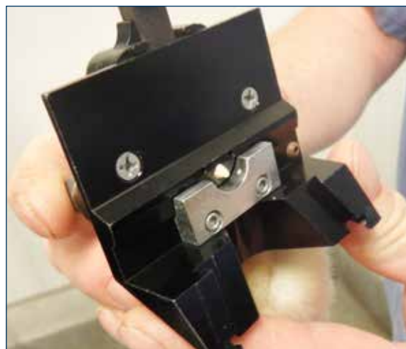
图4.喙部被挂头器板块环绕固定以保护雏鸡