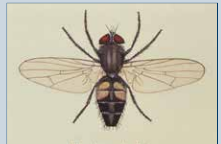
Figura 11. Mosca doméstica.