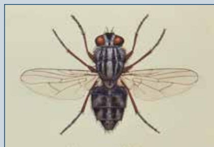
Figura 13. Mosca de establo.