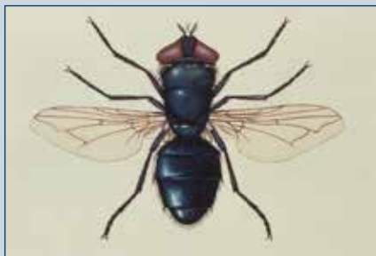
Figura 9. Mosca californida (moscardón).

La mosca doméstica tiende a predominar en las regiones avícolas en los Estados Unidos, pero otras especies como las que se describen abajo pueden ser más comunes en otras áreas del mundo.