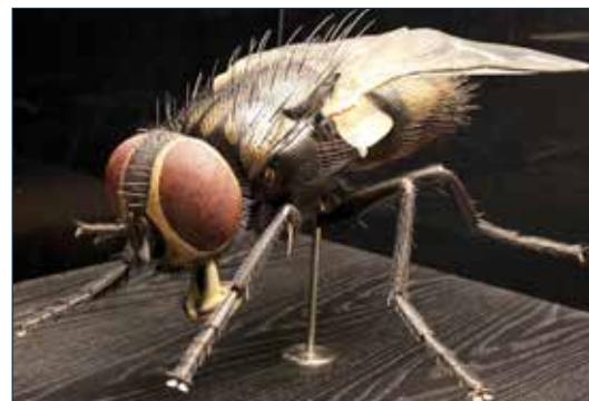
Figura 1. Mosca doméstica.

Las infestaciones de moscas son un gran desafío en las operaciones avícolas. Ya sea que se concentren en el pozo, en el almacenamiento de gallinaza o en el piso, el estiércol de aves es un medio ideal para la reproducción de moscas. Las grandes poblaciones de moscas pueden causar molestias, estrés y una baja en la producción de huevo en las ponedoras, pollonas y reproductoras. Las moscas también son un vector de enfermedades tanto para las aves como para los humanos. En los casos extremos, la falla del control de moscas puede resultar en malas relaciones con la comunidad o hasta en litigios. El control y la prevención de moscas es esencial para el éxito en la crianza y en la producción de aves ponedoras.