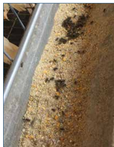
Figura 8. El alimento atrae a las moscas. Esto reduce la eficiencia de alimento y aumenta el riesgo de contaminación.