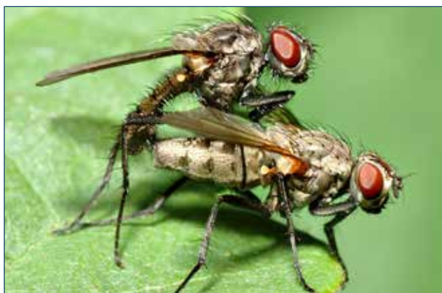
Figura 5. Moscas reproduciéndose.

La larva de mosca tiene una boca con la que mastica y consume cualquier tipo de materia orgánica en su medio ambiente. La mosca adulta, tiene una boca con la que chupa el alimento y consume alimento en estado líquido, o que pueda ser disuelto por el ácido de su saliva 9 .