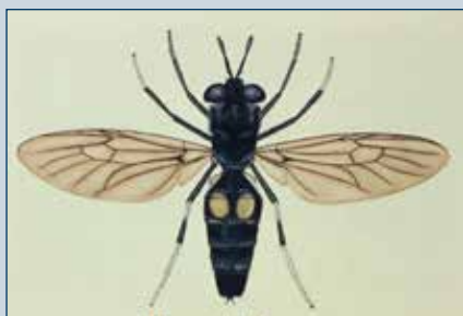
Figura 12. Mosca soldado.