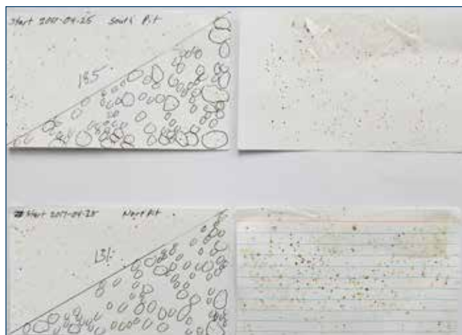
Figura 6. Ejemplos de las tarjetas con manchas colocadas en el pozo de gallinaza. Las tarjetas son marcadas con la fecha, lugar y número de manchas.

La inspección de larva en el pozo de gallinaza es tan importante como el monitoreo de moscas adultas. El pozo de gallinaza debe examinarse diariamente en las áreas húmedas o en áreas donde es visible la concentración de moscas. Se puede escarbar la gallinaza para ver si hay huevos y larva debajo de la superficie. Esto proporciona la oportunidad para una aplicación precisa de insecticida para larva y de productos químicos para secar la gallinaza. La producción de gallinaza diaria, cubre las áreas tratadas, por lo cuál es necesario inspeccionar el pozo regularmente 6,9 .