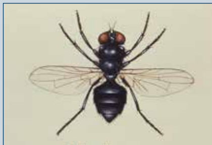
Figura 10. Mosca de basura.