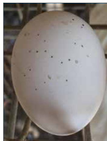
Figura 7. Un huevo con varias manchas indica que hay un problema de moscas.