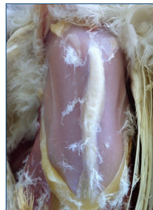
Figura 1. Quilla moderadamente deformada.