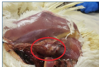
Figura 4. Rebordeo en las costillas (raquitismo).