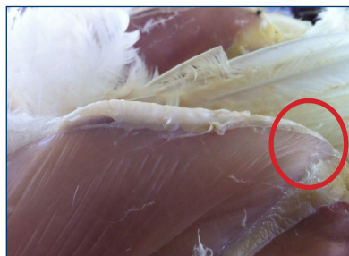
Figura 3. La punta de la quilla debe sentirse sólida al palparla.