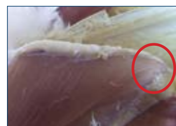
Figura 3. La punta dello sterno dovrebbe apparire solida quando palpata.