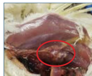
Figura 4. Calcificazioni granulari sulle coste (rachitismo).