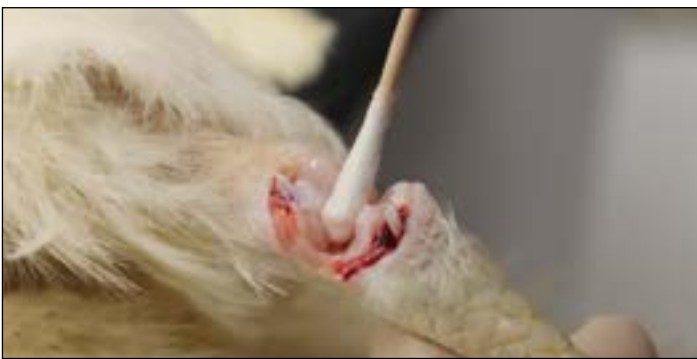
图6.擦拭感染关节的滑液囊表面。