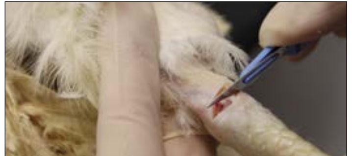
图5.切入关节前先拔除羽毛并用酒精棉清洁皮肤。