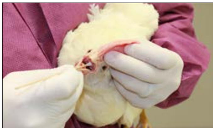
图2.采集咽拭子时固定鸡只的正确方法