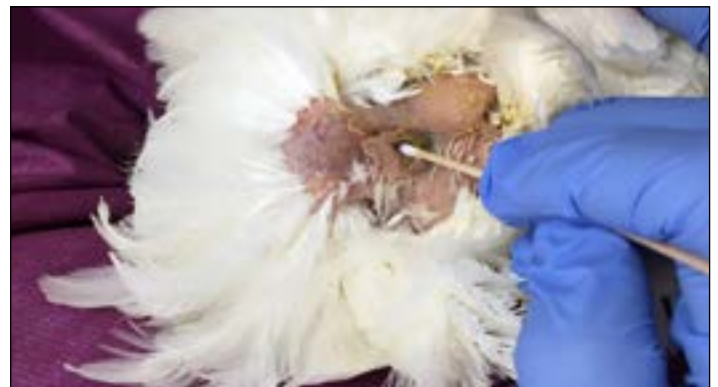
图7.露出泄殖腔, 将拭子轻轻插入泄殖腔并在粘膜表面旋转。