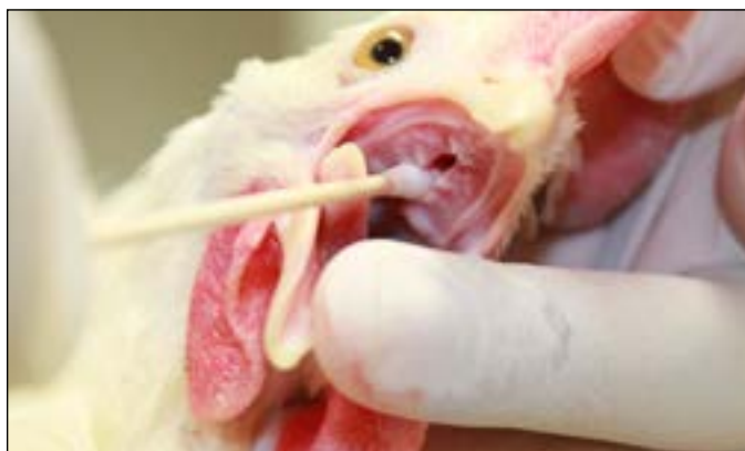
图3.采集咽拭子时确保拭子已插入鼻后孔