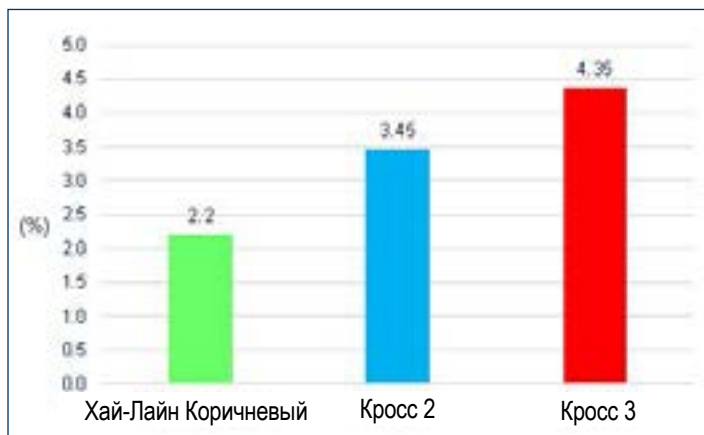
Рис. 1. Падеж (%): Среднее значение для двух стад несушек с недебикированными клювами (50,4 недели яйцекладки).