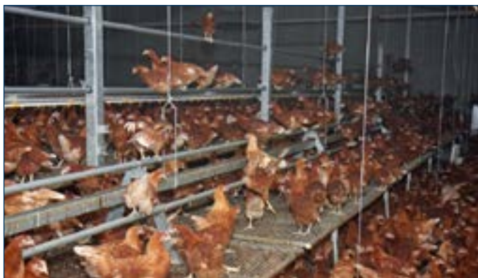
Рисунок 2. Использование приподнятой платформы в птичнике выращивания.