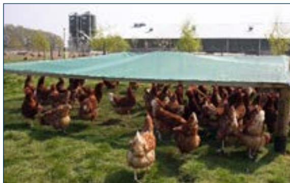
Рис. 7. Площадка для свободного выгула с затенённым участком.