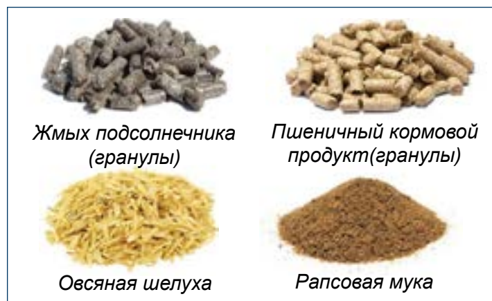
Рис. 8. Сырье, обеспечивающее плотность клетчатки в рационе.

Повышенного уровня клетчатки можно достичь, добавив больше сырьевых компонентов с высоким содержанием клетчатки, таких как шрот подсолнечника, пшеничные отруби, цельный овес (шелуха) или рапсовый шрот (Рисунок 8). Целлюлозные продукты также можно использовать для повышения уровня клетчатки в рационе (в соответствии с рекомендациями поставщика). Рекомендуется использовать смесь клетчатки из различных источников.