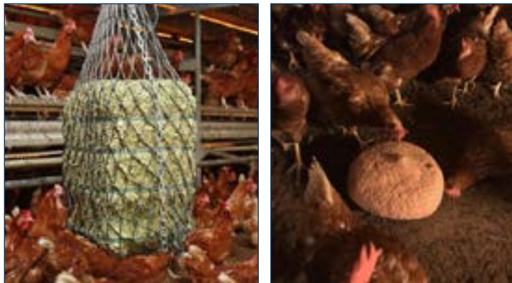
Рис. 6. Материалы для птичников: тюки люцерны (слева) и блоки для расклёва (справа).

Системы естественной вентиляции (рис. 5) рассчитаны на температурную адаптивность. Птицы производят теплый воздух, который поднимается вверх и выходит через вентиляционное отверстие. Когда теплый воздух естественным путём выходит через вентиляционные проёмы, свежий воздух снаружи здания поступает в птичник через боковые впускные отверстия.