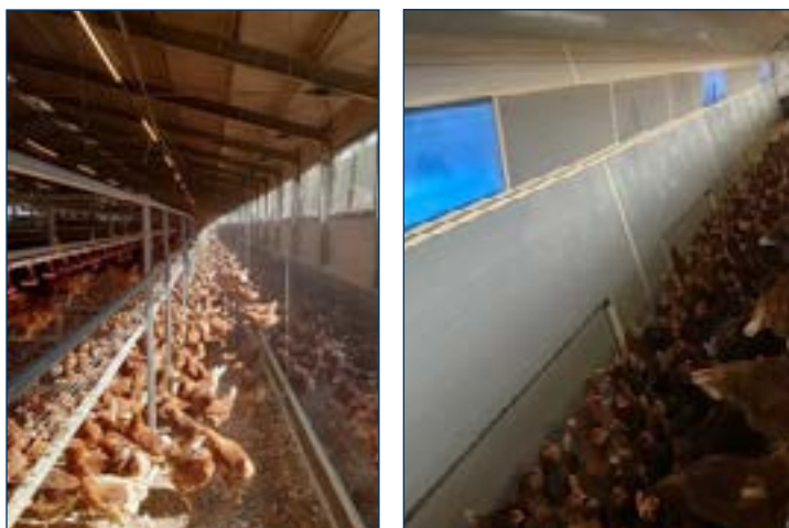
Рисунок 4. Естественный дневной свет в птичниках для выращивания и несушек.