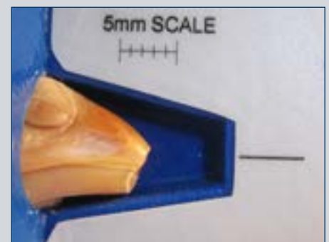
Figura 7. Cuatro semanas después del tratamiento - la punta del pico esta redondeada (sin filo).