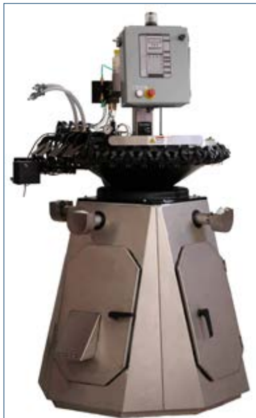
Figura 1. Procesador de Servicio Avícola (PSP) de Nova-Tech.

El despique con tratamiento infrarrojo (IRBT) se realiza con una máquina llamada Procesador de Servicio Avícola (PSP), patentada por Nova-Tech y disponible para su alquiler o arrendamiento (Figura 1). Esta máquina también proporciona inyecciones subcutáneas por medio de inyecciones en el cuello, lo cual reduce el error humano asociado con las inyecciones a mano o inyectores individuales.