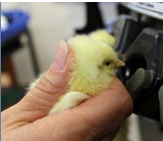
Figura 3. Colocando las aves en los sostenedores de cabezas.