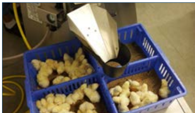
Figura 2. El Procesador de Servicio Avícola (PSP) de Nova-Tech clasifica las aves en las cajas.