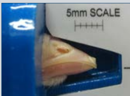
Figura 5. Un día después del tratamiento - el tejido del pico tratado es de color blanco (en lugar de rosado).