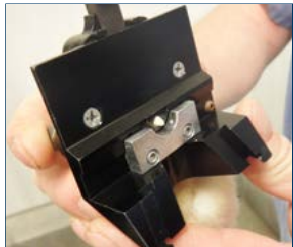
Figura 4. El pico es asegurado con las placas protectoras para proteger a las pollitas.